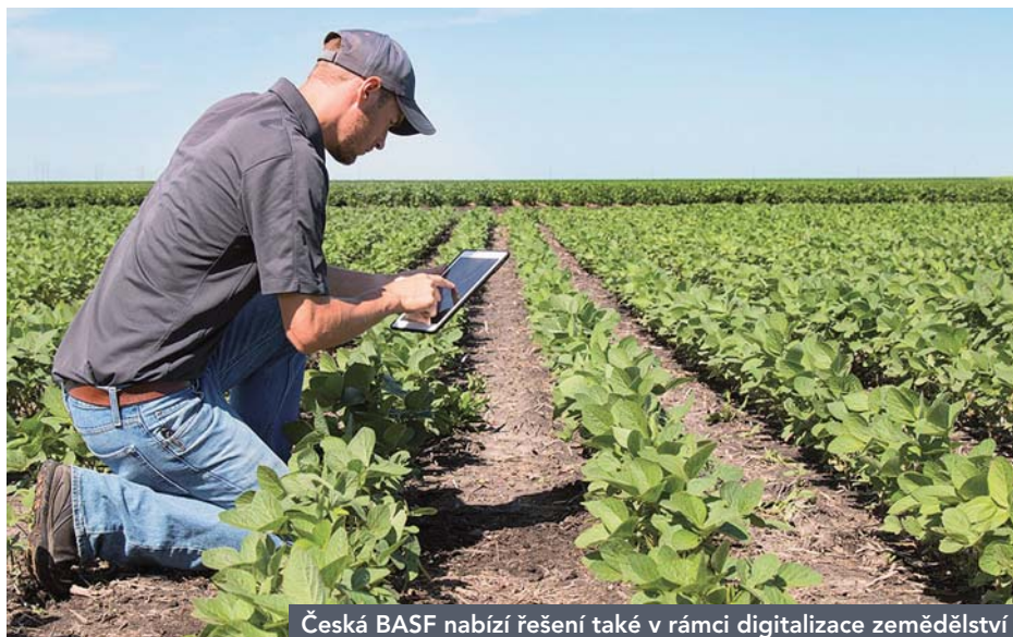
Česká BASF nabízí řešení také v rámci digitalizace zemědělství

jičí tlak legislativních omezení snižuje dostupnost účinných látek určených pro ochranu rostlin: podle odhadů zůstane do roku 2022 na evropském trhu jen 13 % aktuálně registrovaných a komerčně používaných účinných látek. Sečteno a podtrženo, produktivita zemědělství musí podle odhadů stoupnout o 50 % a paralelně s tím je nutné pomoci nových produktů posílit udržitelnost zemědělství i odolnost rostlin vůči stresu. Zní to možná paradoxně, ale agrochemický gigant jako BASF se prostřednictvím digitálních nástrojů, jež zemědělcům poskytuje, zasazuje o to, aby zemědělská chemie byla co nejšetrnější, neefektivnější a aby se jí používalo jen tolik, kolik je nezbytně nutné. Že se nám v hledání rovnováhy mezi ekonomickými, ekologickými a společenskými požadavky daří, o tom svědčí nejen know-how získané ve spolupráci např. s farmou Lukavec, ale především strmě rostoucí poptávka po hlavních dvou aplikacích, které BASF nabízí. Těmi jsou SCOUTING a FIELD MANAGER. SCOUTING používalo na přelomu roku 3,6 miliónu zemědělců, tedy o 80 % více než v předchozím roce; oproti tomu FIELD MANAGER zaznamenal 140% navýšení celkového počtu uživatelů na 39 000 a plocha obdělávaná s pomocí této aplikace vzrostla o více než 70 % na hodnotu přesahující 4,7 miliónu hektarů.