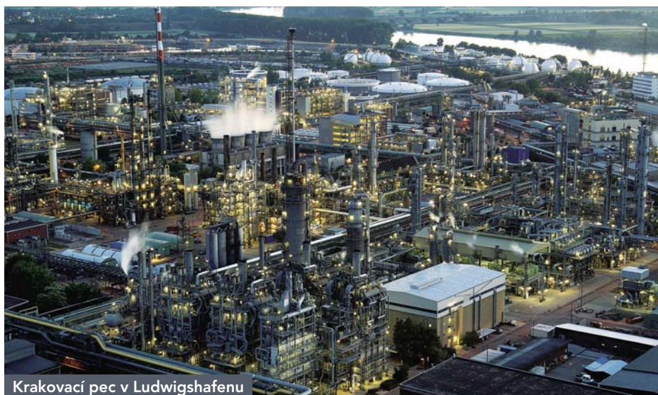
Krakovací pec v Ludwigshafenu

Obecně to znamená maximální efektivitu, transparentnost i nahrazování neobnovitelných surovin udržitelnými alternativami bez nejmenších kompromisů v otázce kvality. V podnikání zároveň uplatňujeme zásadu rovnováhy tří aspektů: ekonomického, ekologického a spo-