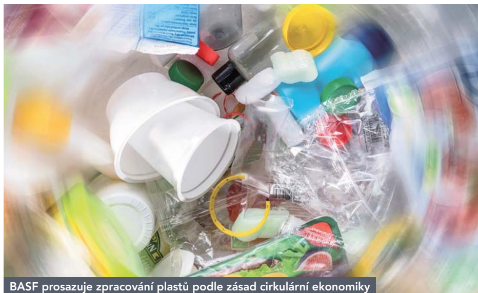
BASF prosazuje zpracování plastů podle zásad cirkulární ekonomiky

Konkrétně v produkci potravin má věda důležitý a nelehký úkol. Situace zemědělců nebyla ani dříve růžová, v důsledku klimatických změn i společenského vývoje se ale stává čím dál zapeklitější a bez podpory vědy by se mohla stát bezvýchodnou. BASF tu vnímá nejen businessový potenciál, ale také potřebu podpořit celé odvětví a pomoci k jeho modernizaci. Proto právě sem míří nemalá část našich investic. Jen za rok 2020 jsme na R & D v rámci zemědělství vynaložili 0,9 miliardy eur, což je zhruba 11 % tržeb naší agro divize. Vývoj zemědělských inovací se podobá řešení rovnice o mnoha neznámých: zatímco světová populace roste a v roce 2050 dosáhne počtu 9,7 miliardy lidí, množství orné půdy zůstává konečné. Současně s tím postupuje globální oteplování, které má na zemědělskou produkci negativní dopady. Navíc se neustále zpřísňují společenské požadavky na udržitelnost zemědělské produkce a ochranu biologické rozmanitosti, což se projevuje mj. v legislativě. Právě narůstá-