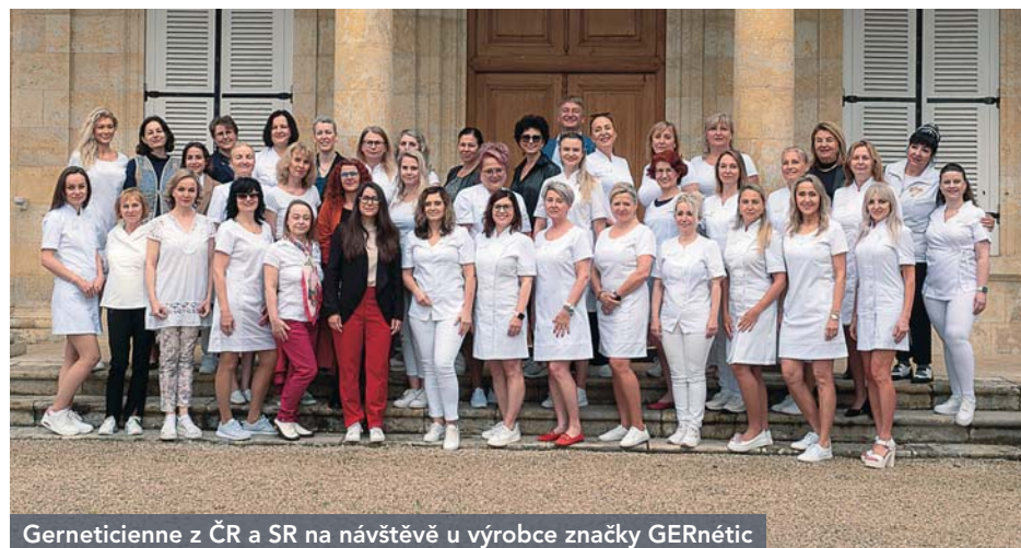
Gerneticienne z ČR a SR na návštěvě u výrobce značky GERnétic